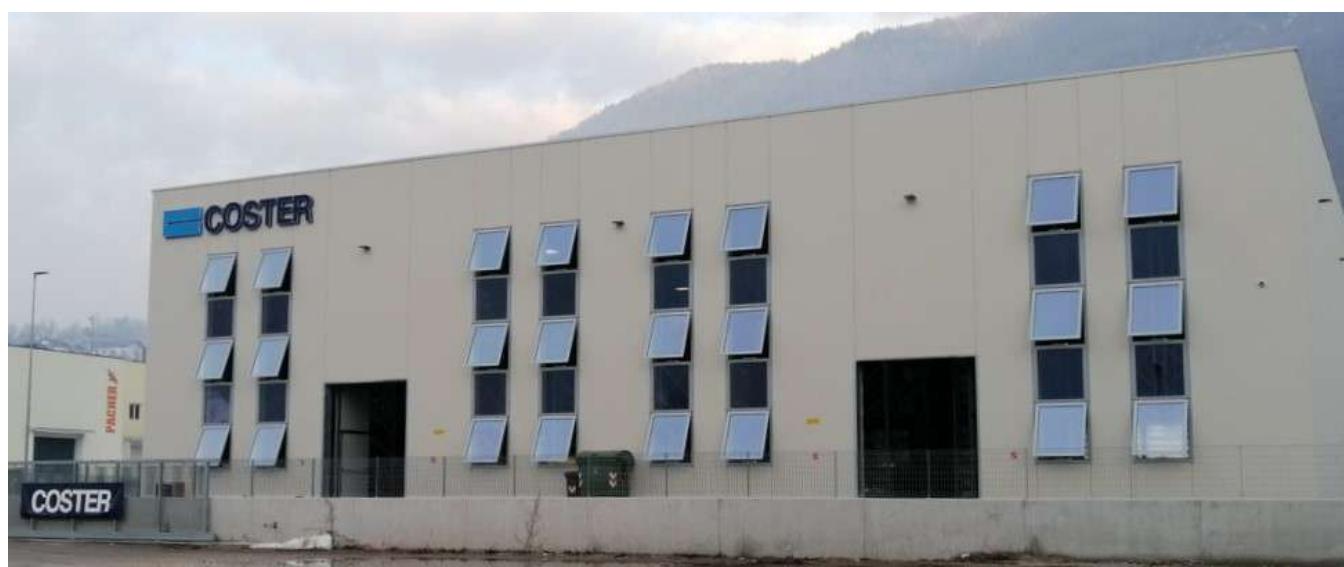
Serramenti a Sporgere nuovo capannone COSTER a Novaledo (TN)