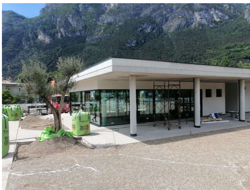
Nuova struttura ricettiva del parcheggio Parco della Libertà a Riva del Garda (TN)