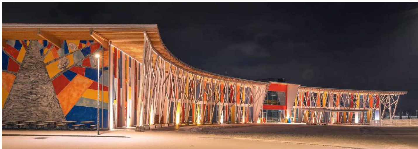
Nuova Scuola Elementare su struttura X-Lam di Borgo Valsugana (TN)