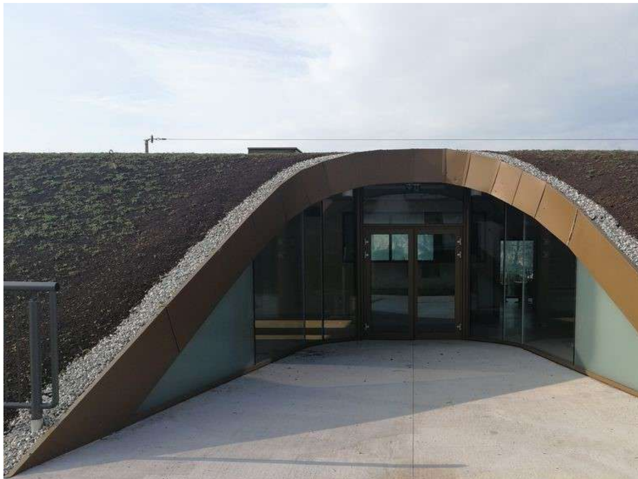
Facciate ad incavo Scuola Elementare di Pressano (TN)