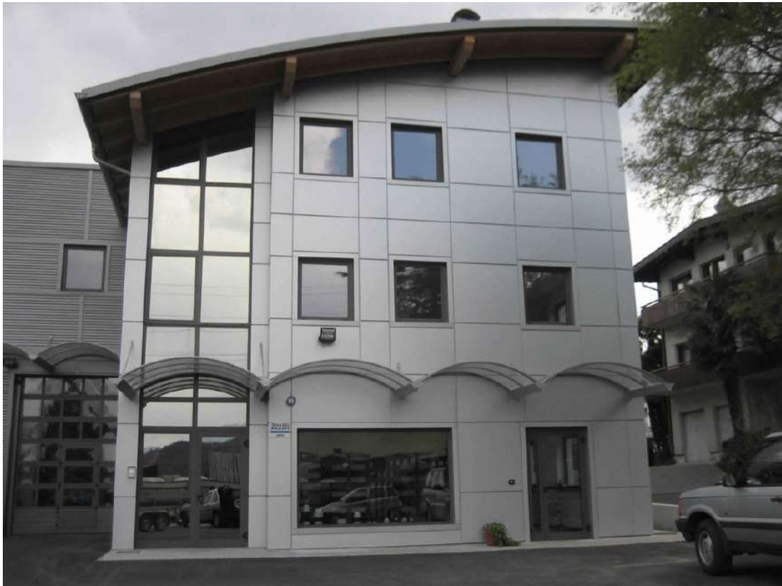
Serramenti e parete ventilata della sede Tomaselli Irrigazioni a Ravina (TN)