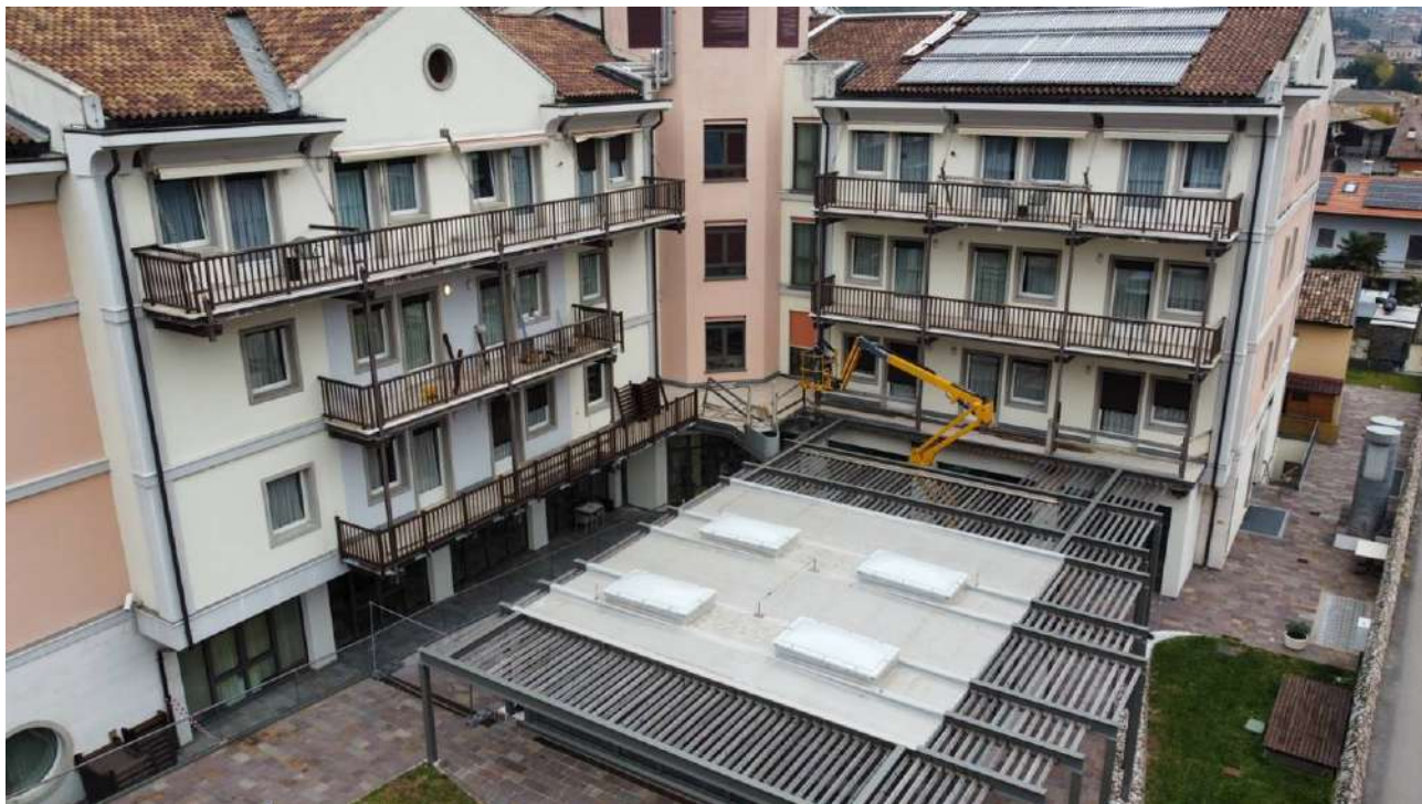
Ringhiere in Alluminio ed Evacuatori di Fumo presso A.P.S.P. - Avio (TN)