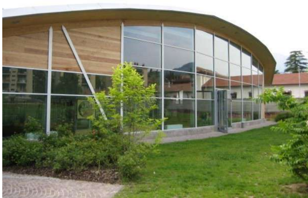
Serramenti Bocciodromo Comunale - Trento (TN)