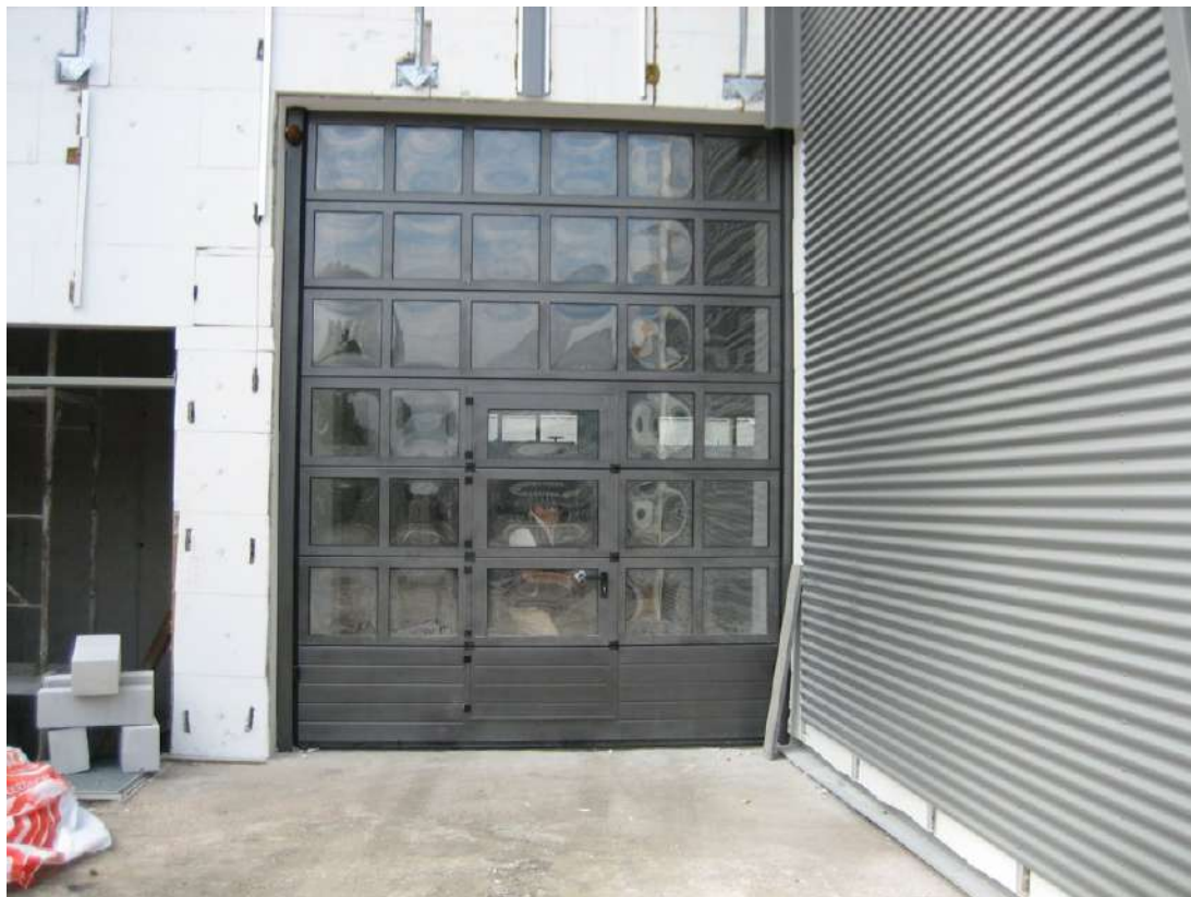
Portone Sezionale in alluminio