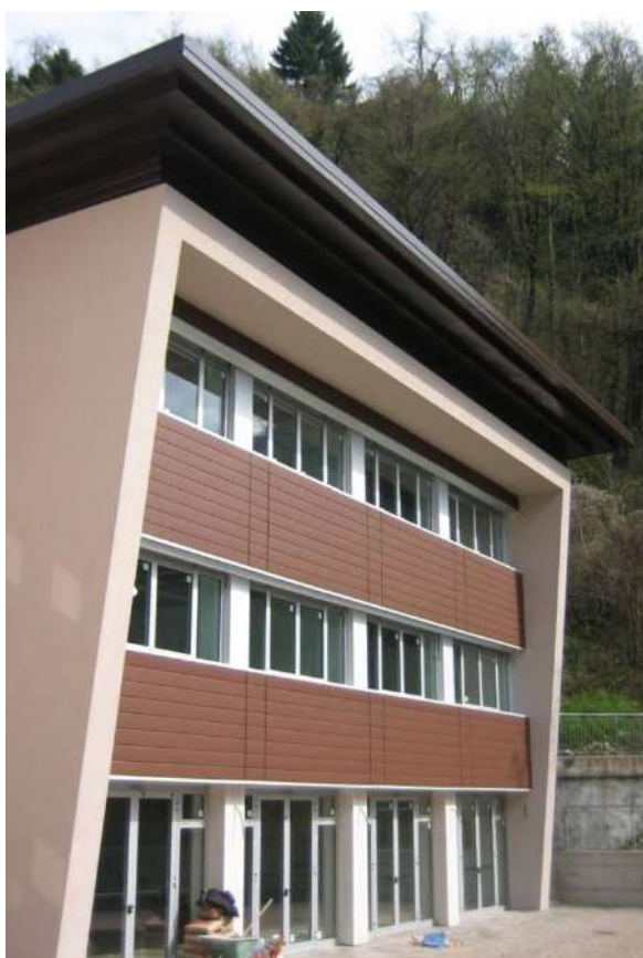
Ristrutturazione scuola elementare con pannellature di Villa Agnedo (TN)