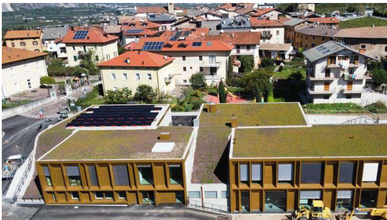
Nuova Scuola Elementare con lamiera pressopiegata coniche di Pressano (TN)