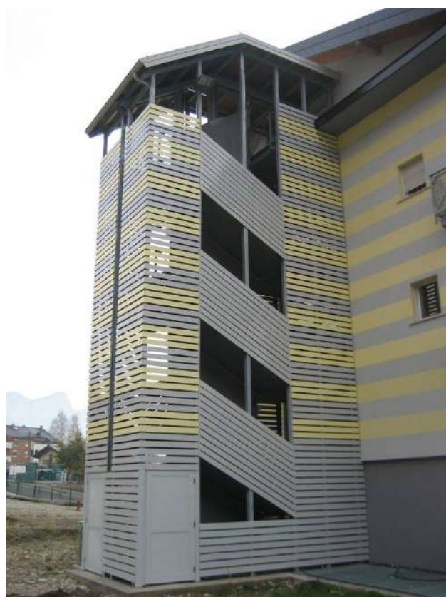
Rivestimento scala antiincendio con doghe in alluminio