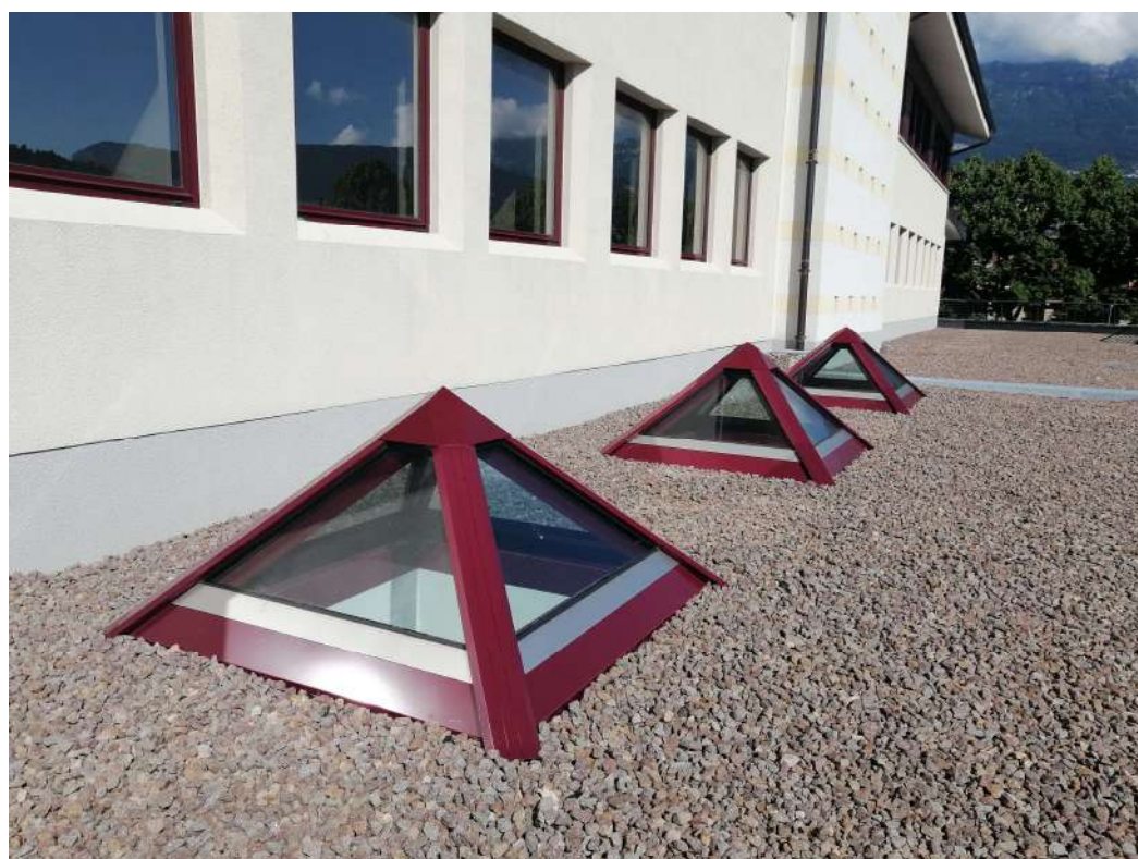
PIRAMIDI VETRATE del nuovo centro sociale di Rovereto (TN)