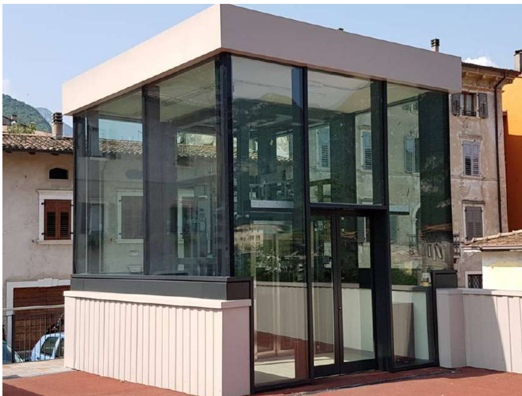
Torretta Ascensore Vetrata - Ala (TN)