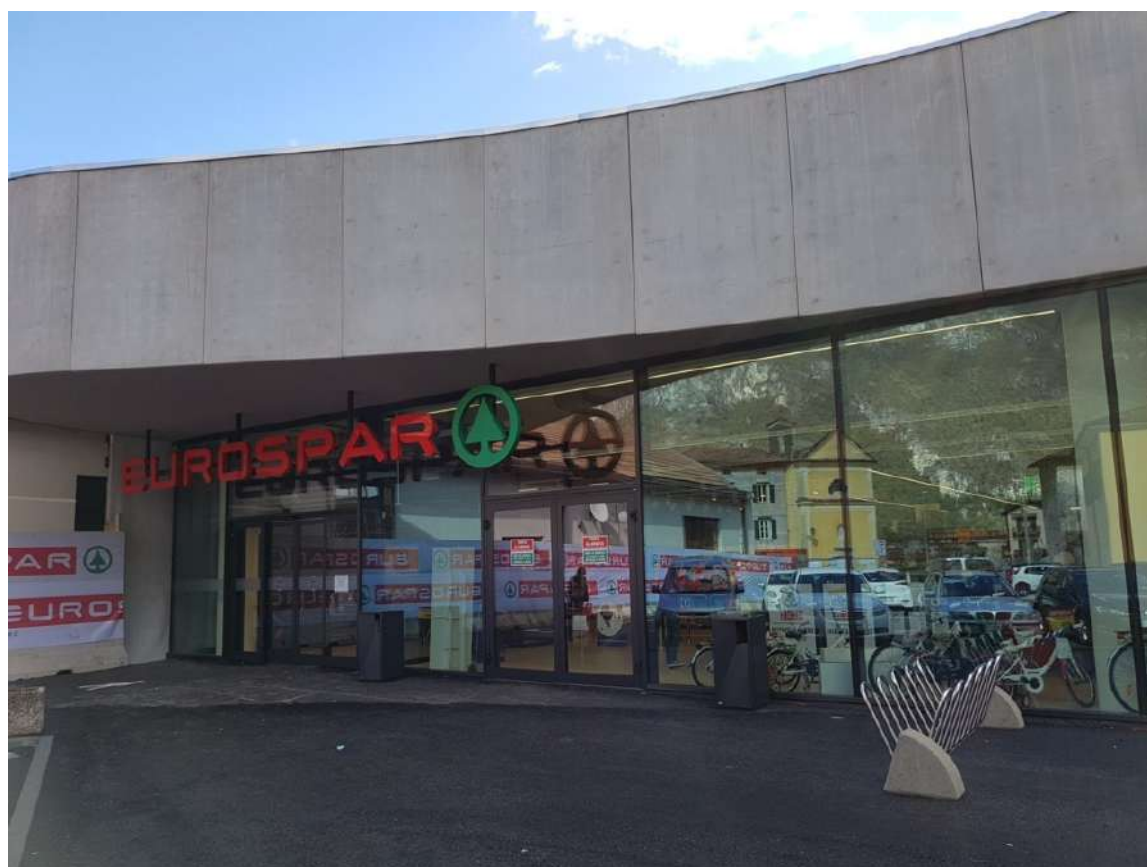
Nuova Sede EUROSPAR di Ala (TN)