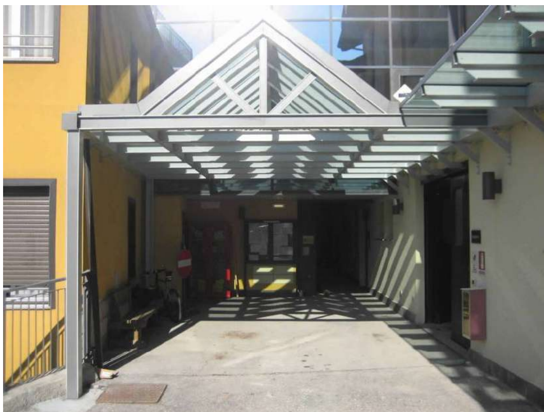
Tettoia entrata principale della A.P.S.P. Piccolo Spedale di Pieve Tesino (TN)