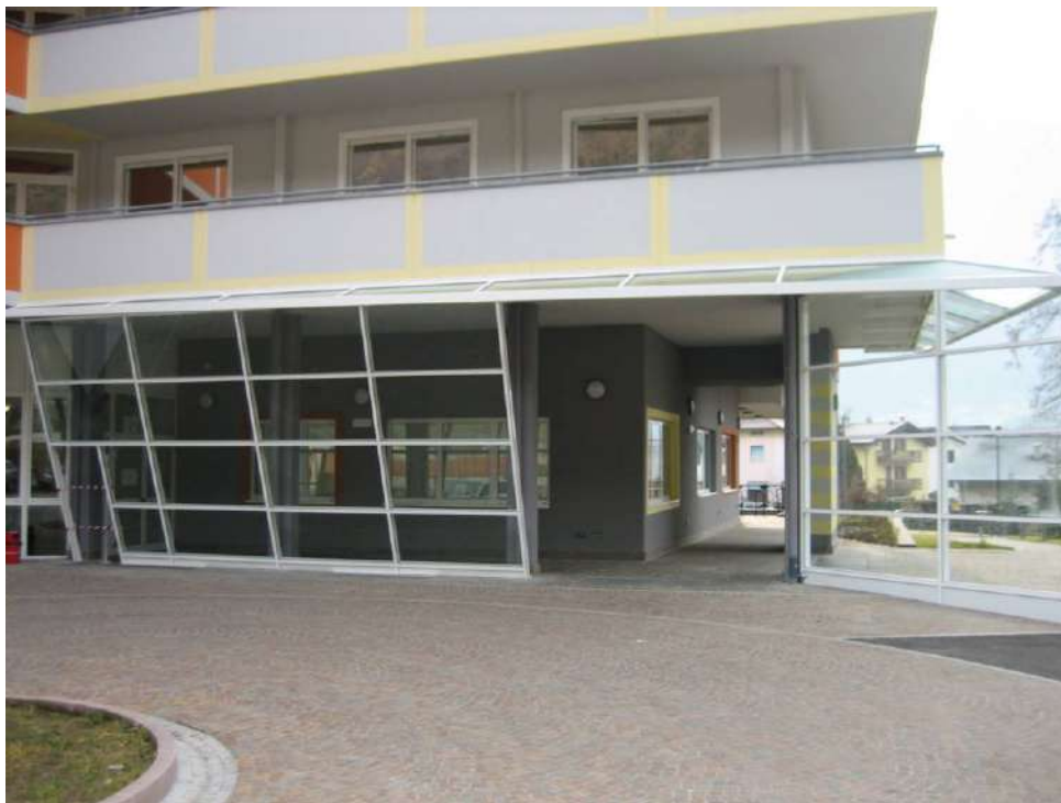
Casa Riposo S.Lorenzo e S. Maria di Borgo Valsugana (TN)