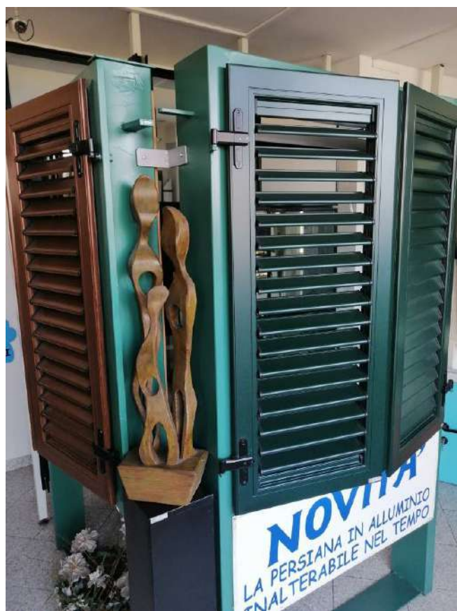
Tipologie diverse di persiane in alluminio nostro Showroom