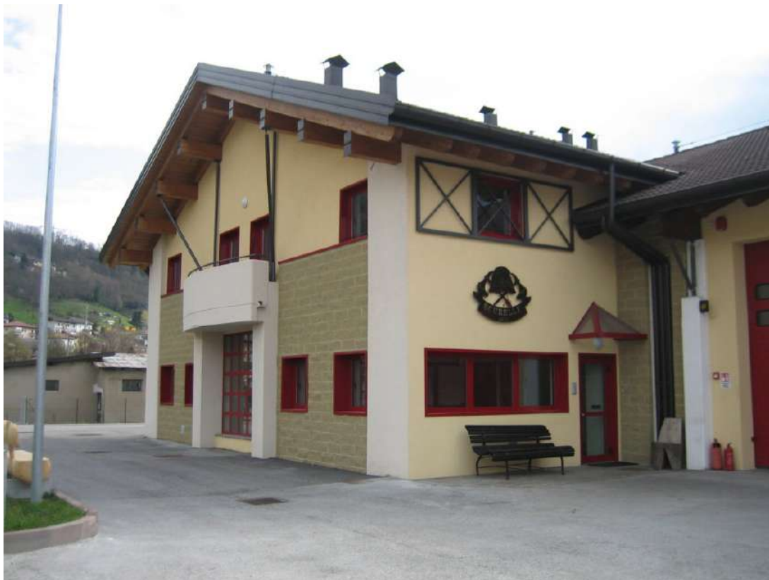
Serramenti e Pensilina della Caserma dei V.V.F. di Scurelle (TN)