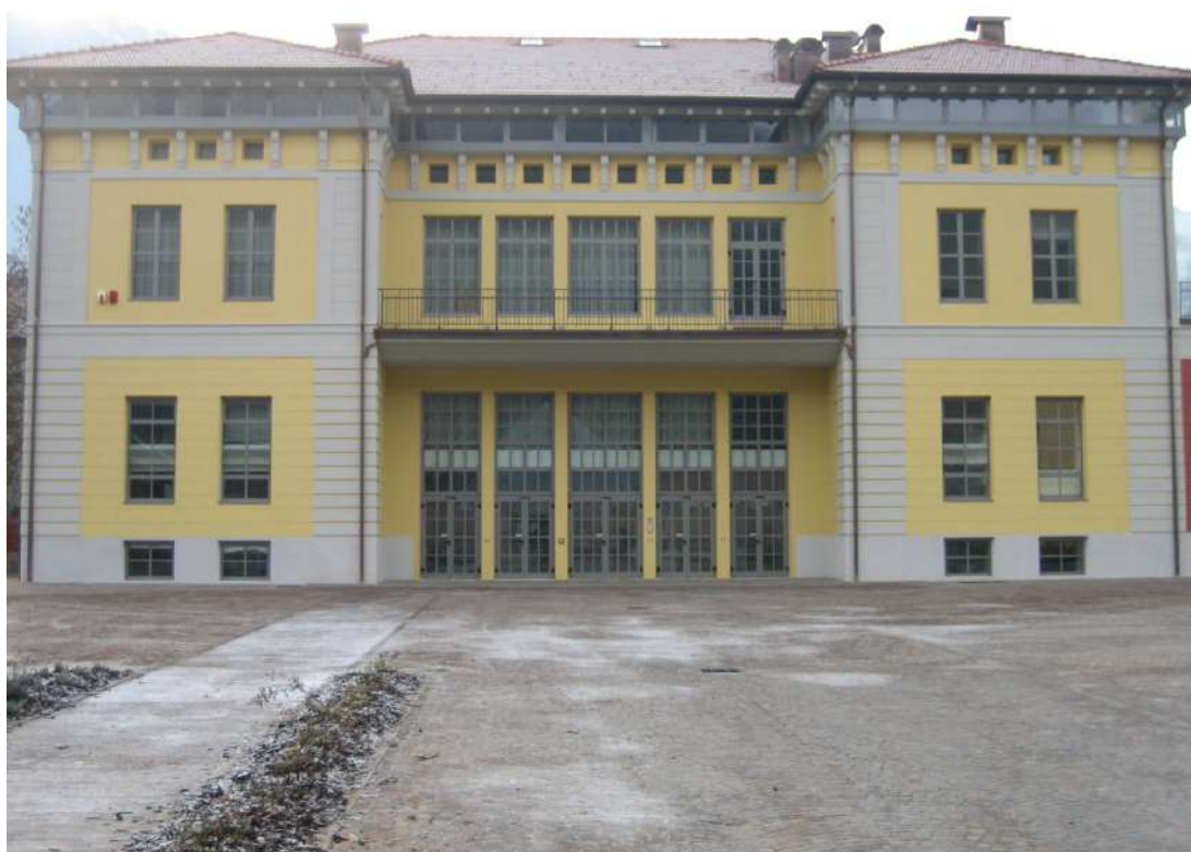
Serramenti Oratorio Parrocchia della Natività di Maria di Borgo Valsugana (TN)