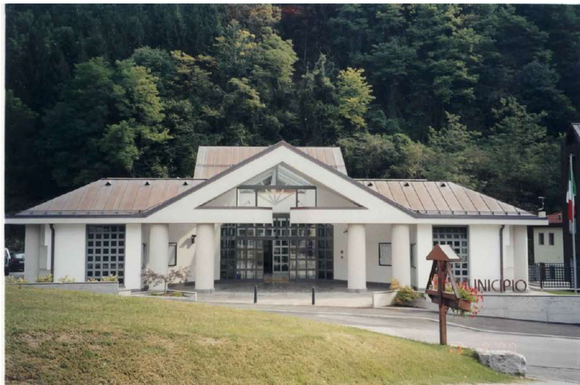
Serramenti esterni sede Comune Castel Ivano di Villa Agnedo (TN)