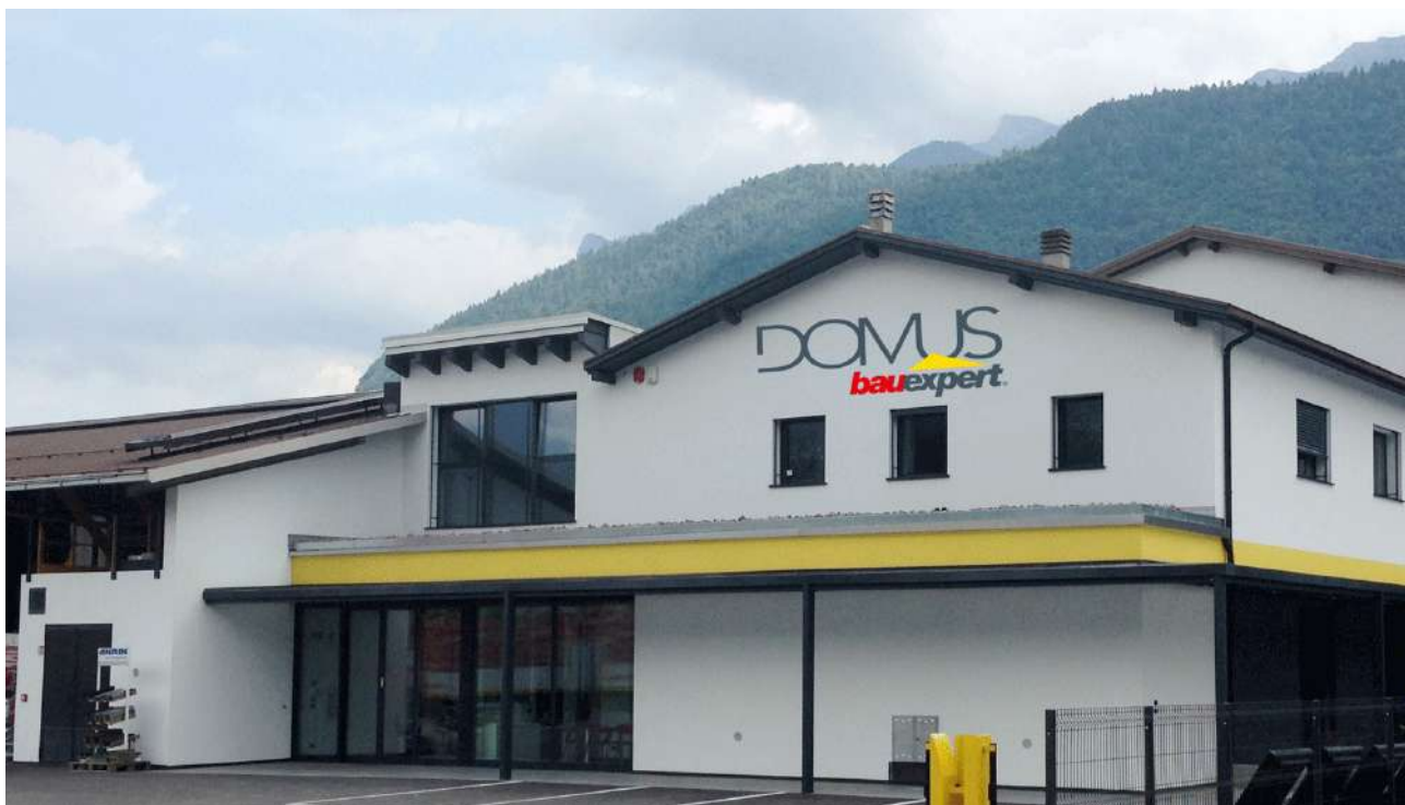
Nuova Sede BAUEXPERT di Borgo Valsugana (TN): pensilina esterna, serramenti, lucernario interno e porte automatiche