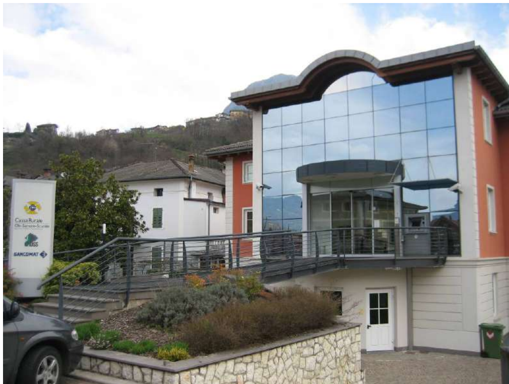
Sede Cassa Rurale Valsugana e Tesino di Scurelle (TN)