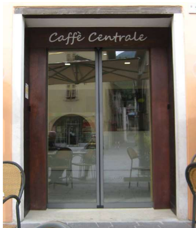
Ingresso con lamiere Cor-Ten e porta automatica - Pergine Valsugana (TN)