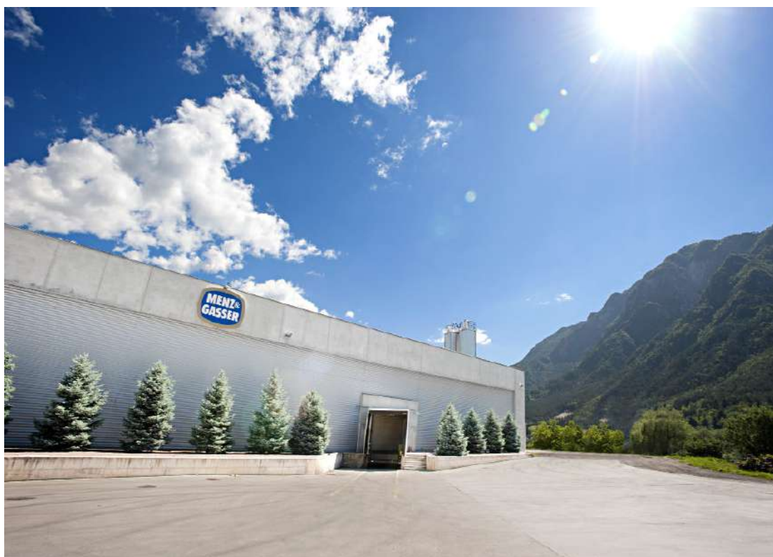
Serramenti Nuovo Stabilimento-Uffici-Biomassa Menz & Gasser di Novaledo (TN)