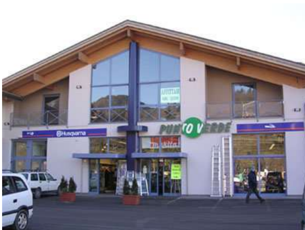
Serramenti Centro Commerciale Ponte Regio - Pergine Valsugana (TN)