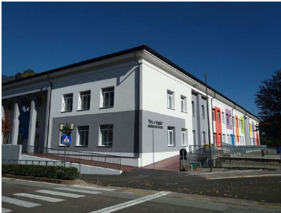
Davanzali in alluminio per la ristrutturazione della Scuola Media di Borgo Valsugana (TN)