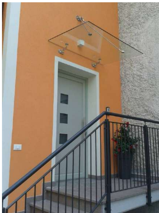
Pensiline vetrate marca Faraone - Ospedaletto (TN)