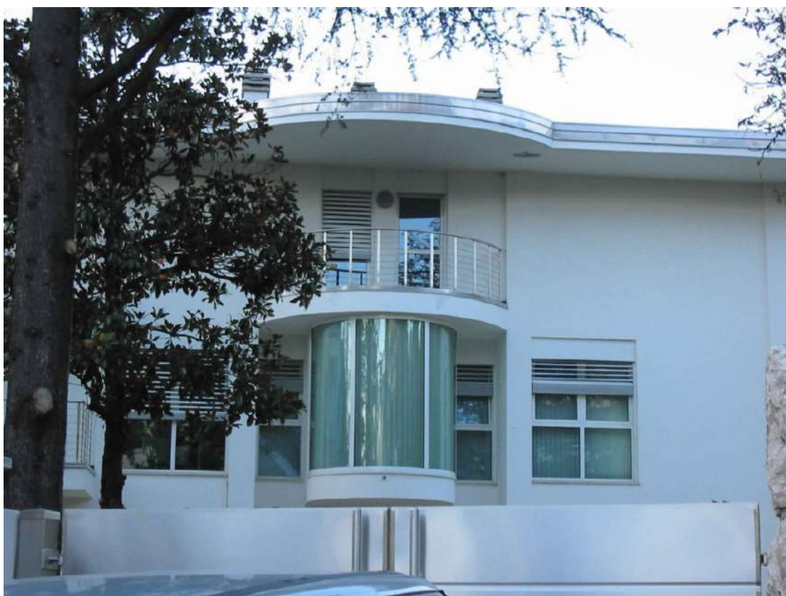
Serramenti esterni curvi e Frangisole casa privata - Trento (TN)