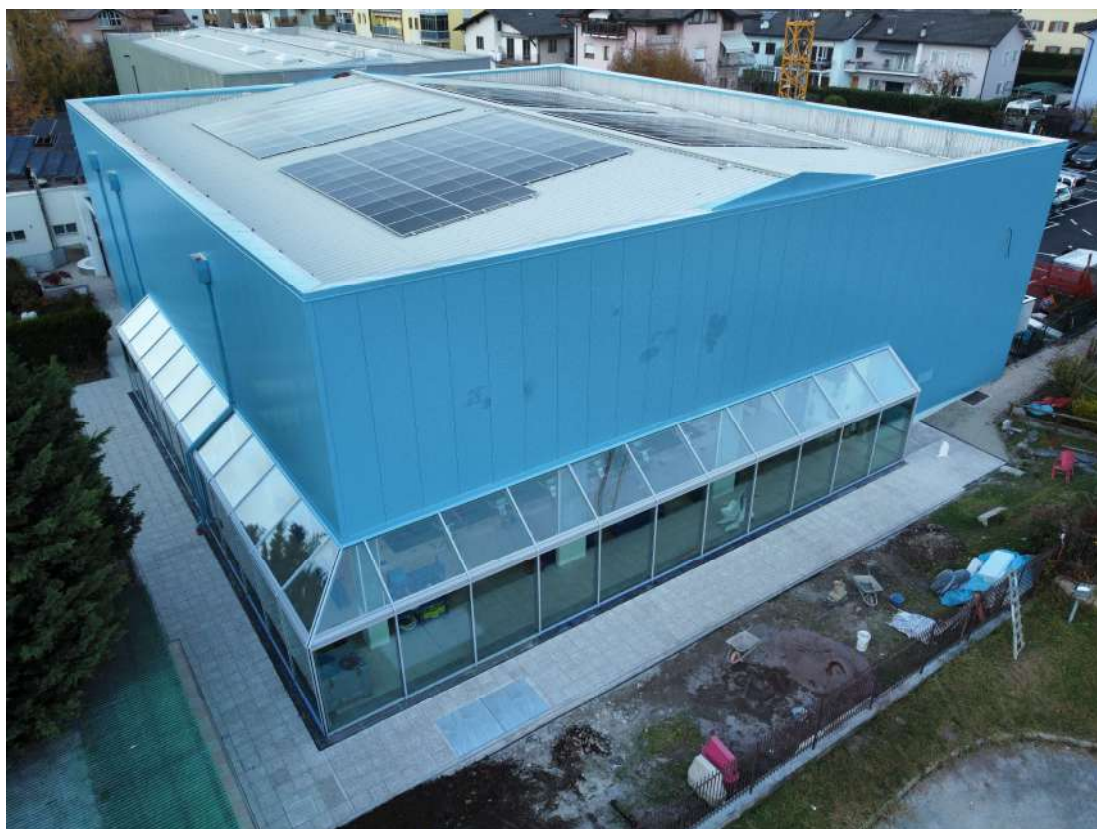
Nuovi serramenti Piscina Comunale di Pergine Valsugana (TN)