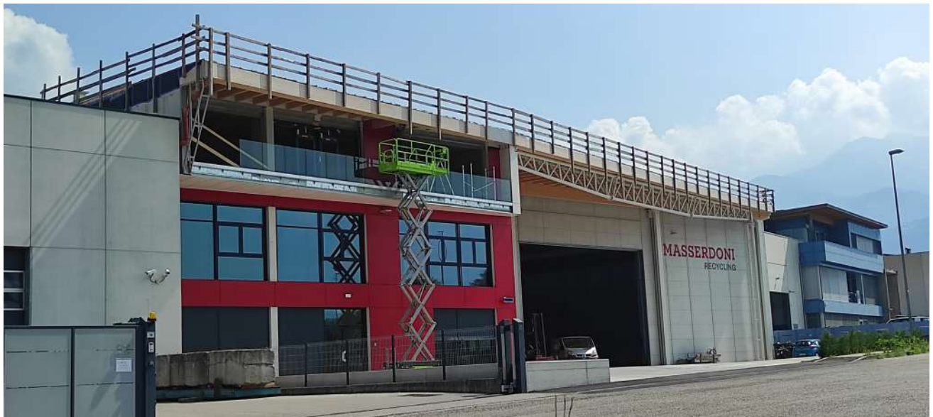
Nuova sede MASSERDONI Recycling a Pergine Valsugana (TN)