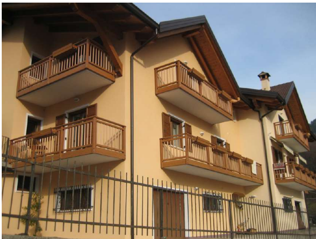
Ringhiere in alluminio alla "Trentina" - Ivano Fracena (TN)