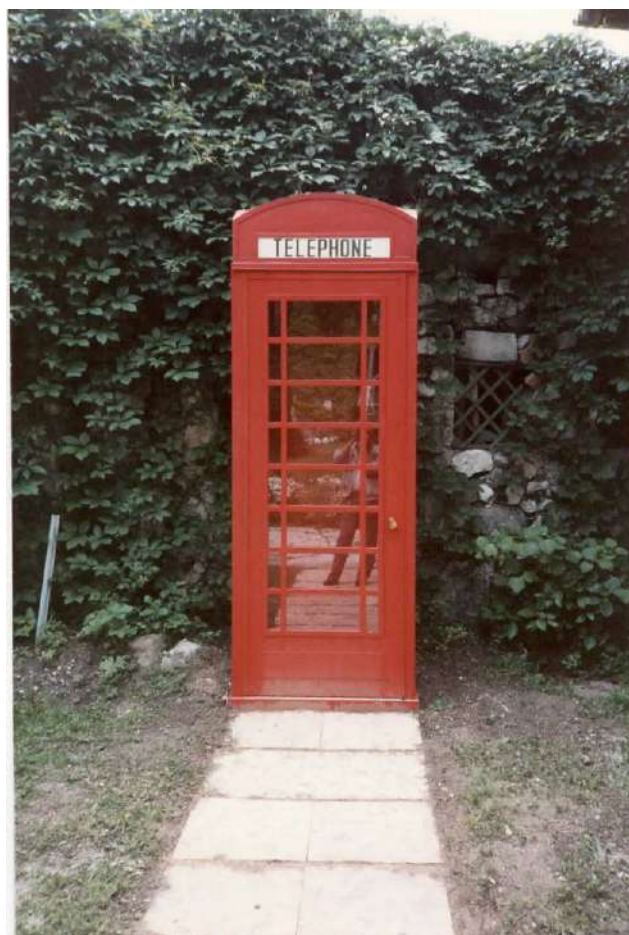
Cabina telefonica stile “londinese” sita presso il parco del Castel Ivano ... e tanto altro