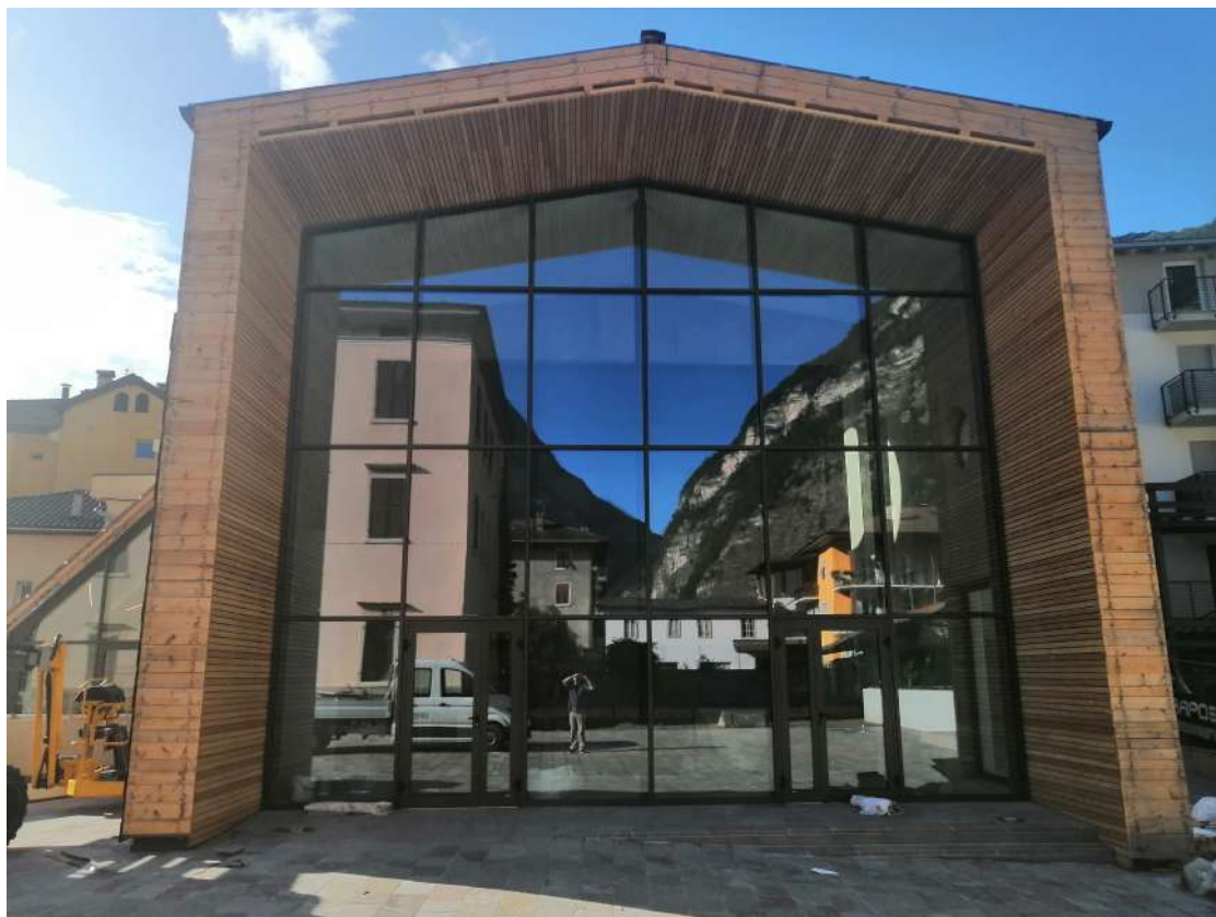
Chiesa sconsacrata adibita a pubblico utilizzo in Piazza della Vittoria a Mezzolombardo (TN)