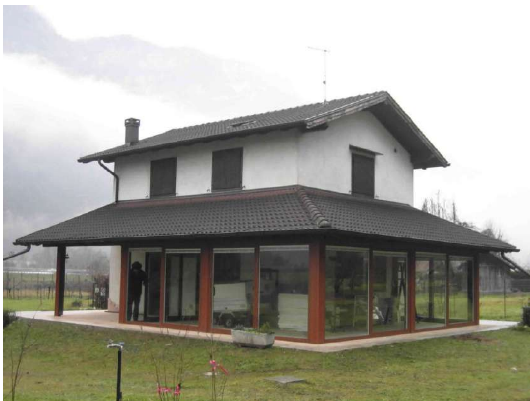
Veranda scorrevole alluminio tinta legno - Grigno (TN)