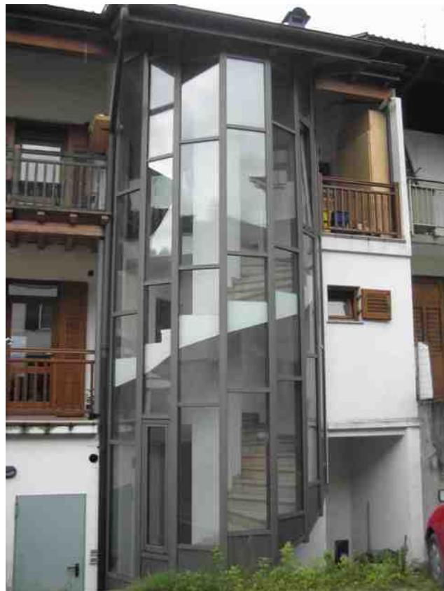
Copertura esterna scala abitazione privata a Strigno – Castel Ivano (TN)