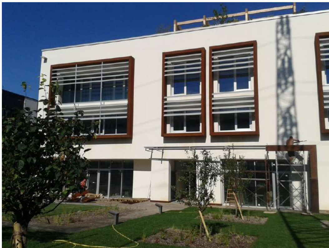
Nuova sede CO.DI.PR.A. Coldiretti a Gardolo (TN)