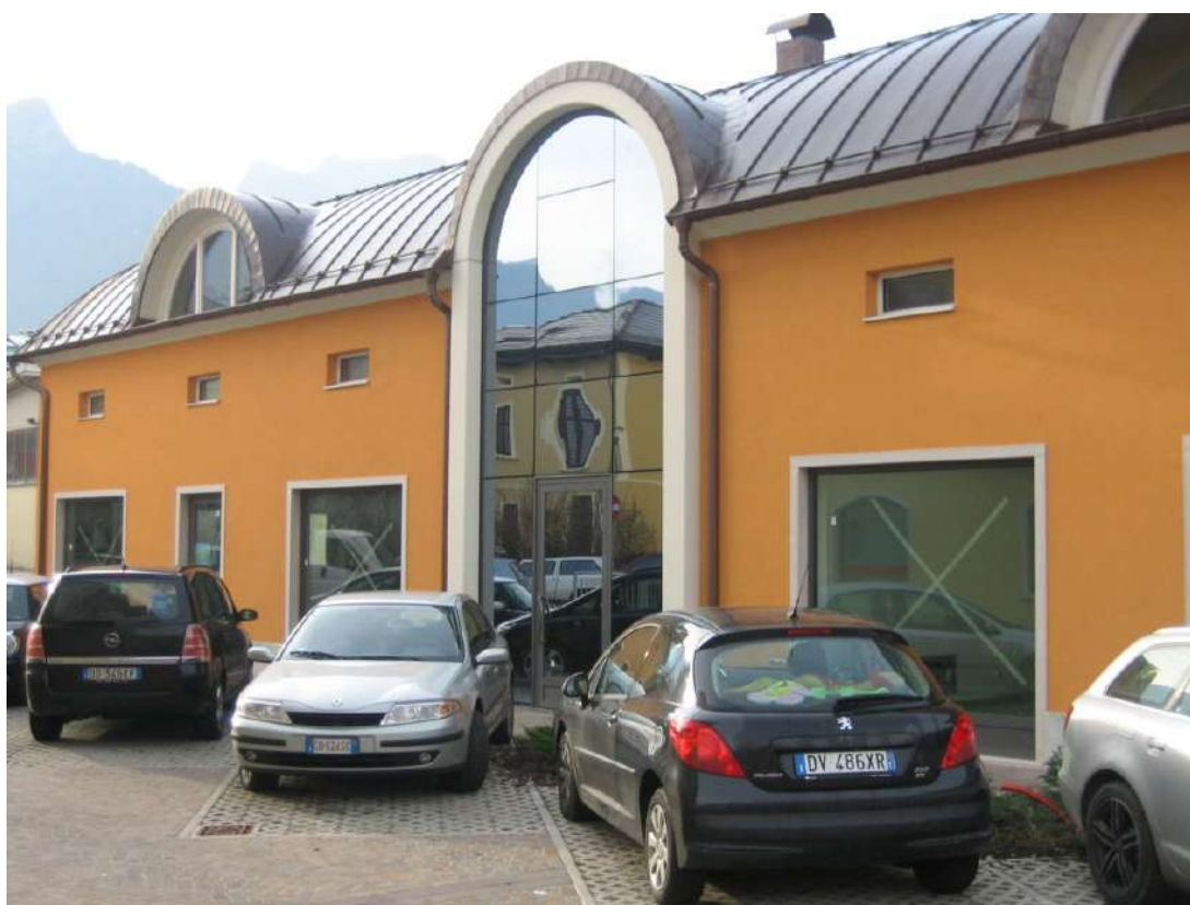
Palazzina uffici - Borgo Valsugana (TN)