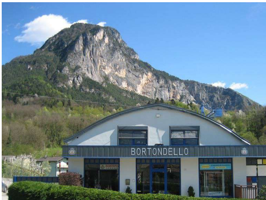
La nostra sede in Via Roma n°39, 38059 Fraz. Strigno – CASTEL IVANO (TN)