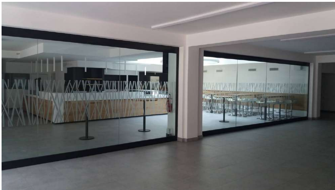
Pareti divisorie interne bar Fondazione Edmund Mach - S. Michele all'Adige (TN)