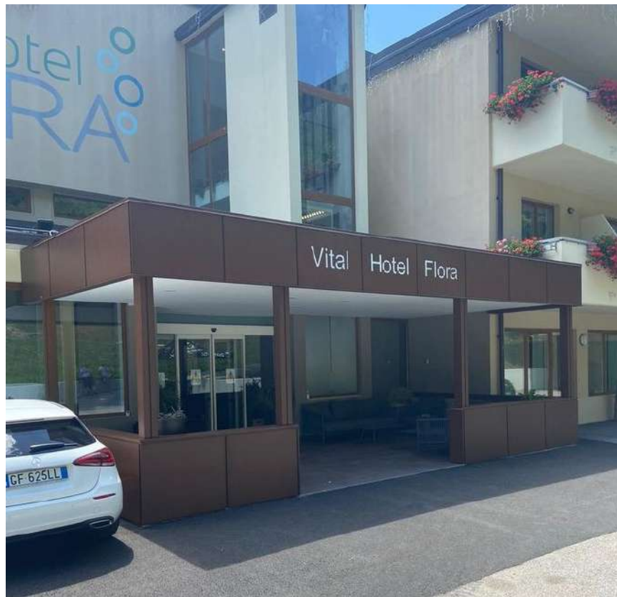
Carpenteria Metallica Leggera con rivestimento in Cor-Ten - Comano Terme (TN)