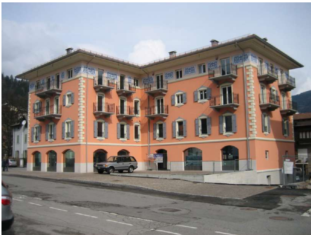
Complesso “Il Centrale” - Tione di Trento (TN)