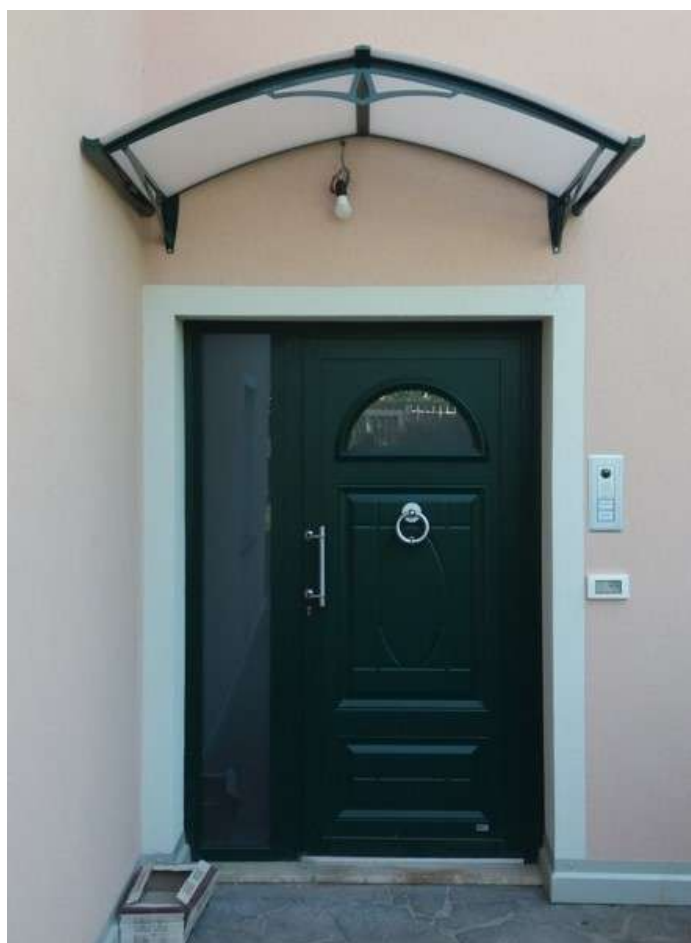
Portoncini di Blindati e di Sicurezza con Tettoie - Pergine Valsugana (TN)