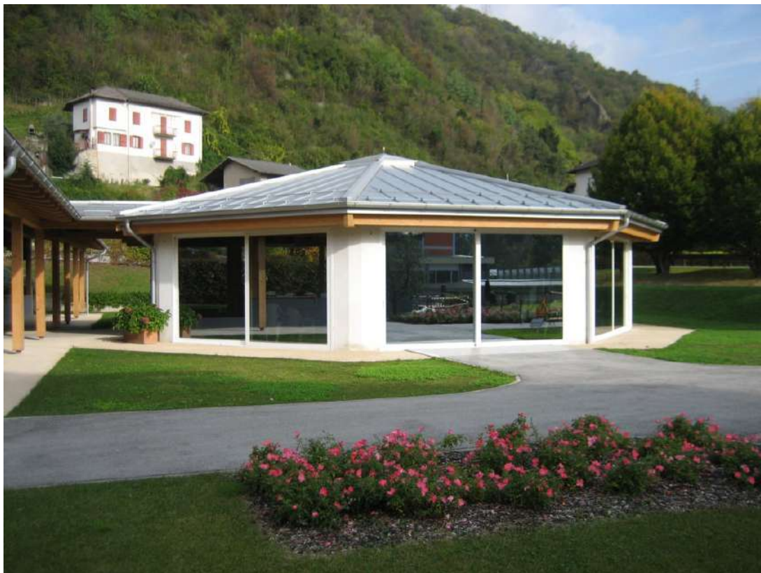
Serramenti Scorrevoli padiglione esterno Casa Riposo S.Lorenzo e S. Maria di Borgo Valsugana (TN)