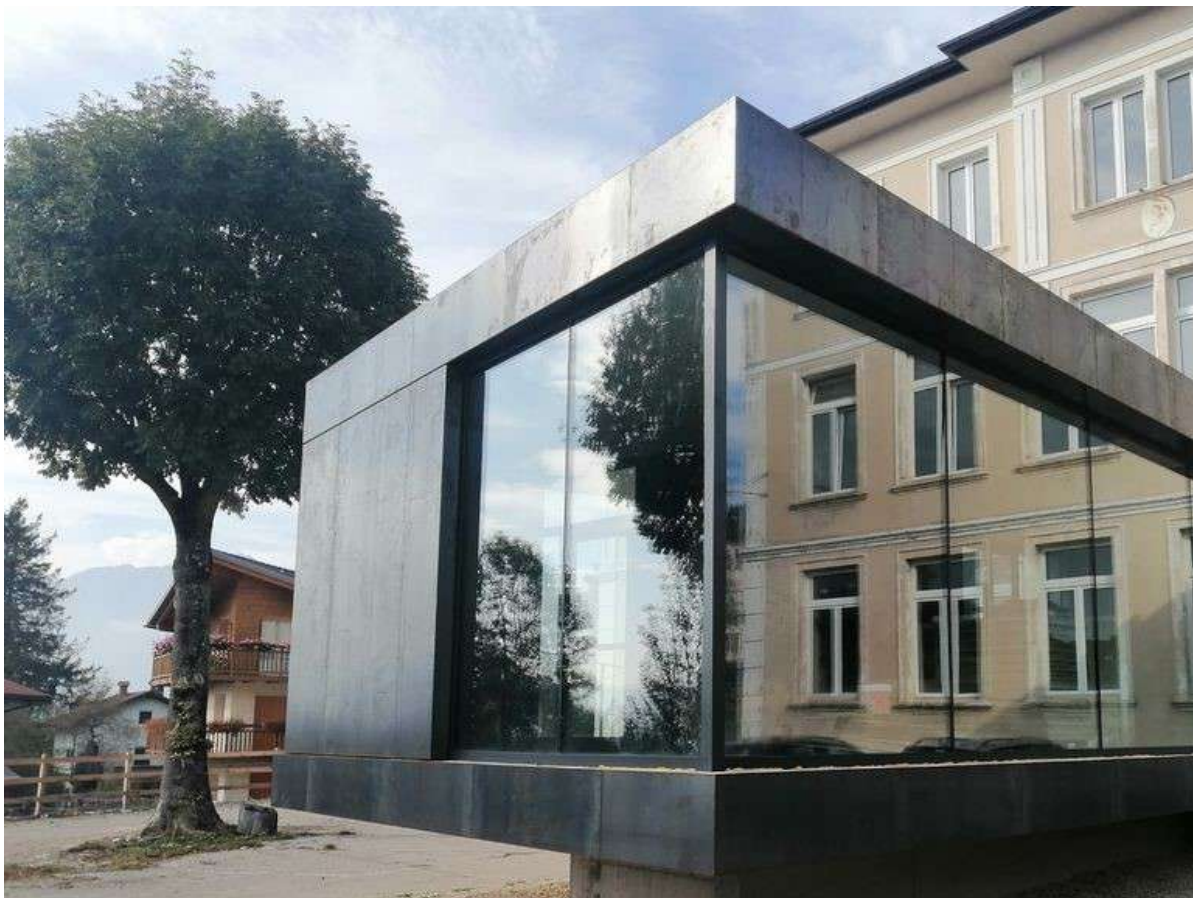
Entrata nuovo Museo "Radici" di Lavarone (TN)