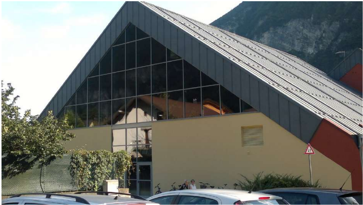
Ristrutturazione Palestra Comunale a Grigno (TN)