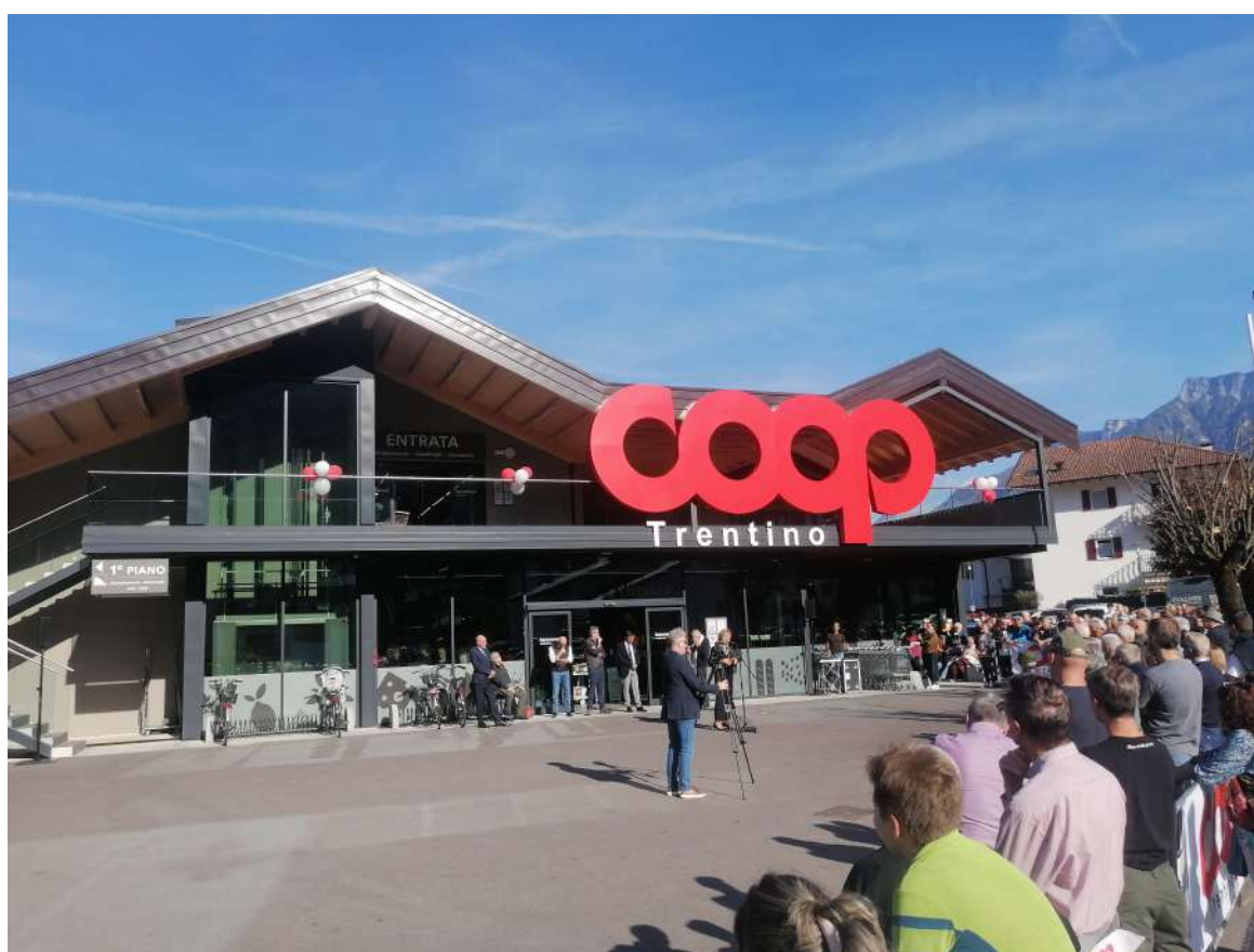
Nuova sede della Famiglia Cooperativa di Caldonazzo (TN)