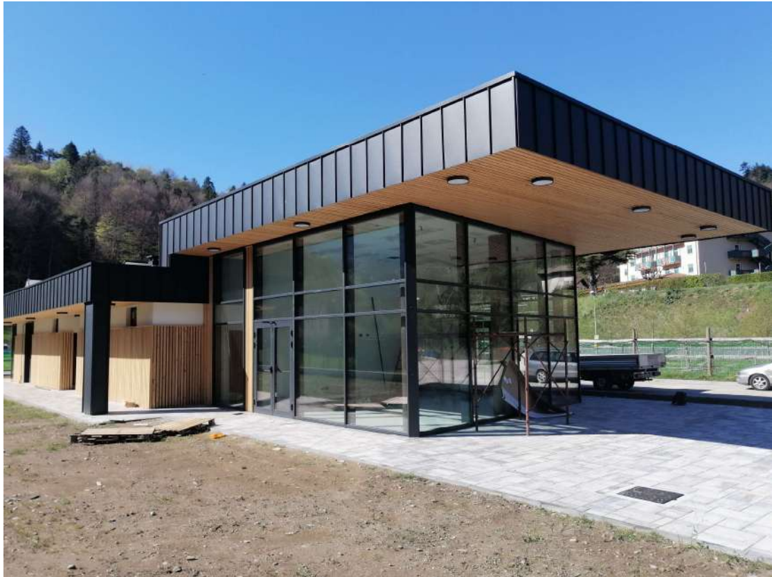
Nuova Area Camper di Comano Terme (TN)